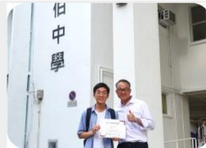
「愛心全達凱普學人計劃」獎學金

List of Textbook for 2024/2025 School Year