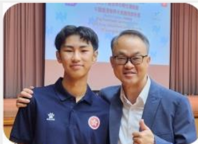
20 th ISF Gymnasiade 2024 - Team Briefing and Flag Presentation Ceremony